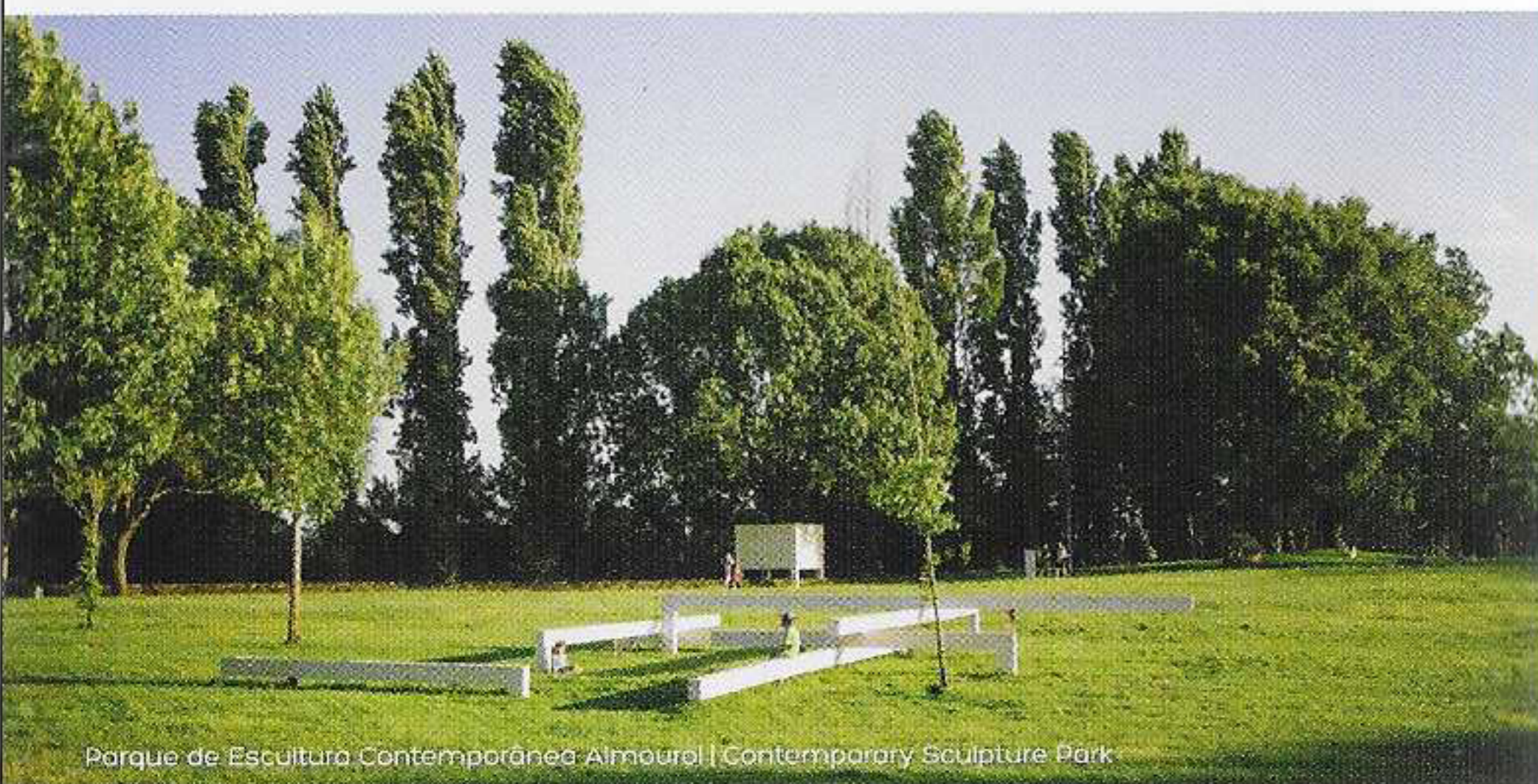
Parque de Escultura Contemporânea Almourol | Contemporary Sculpture Park