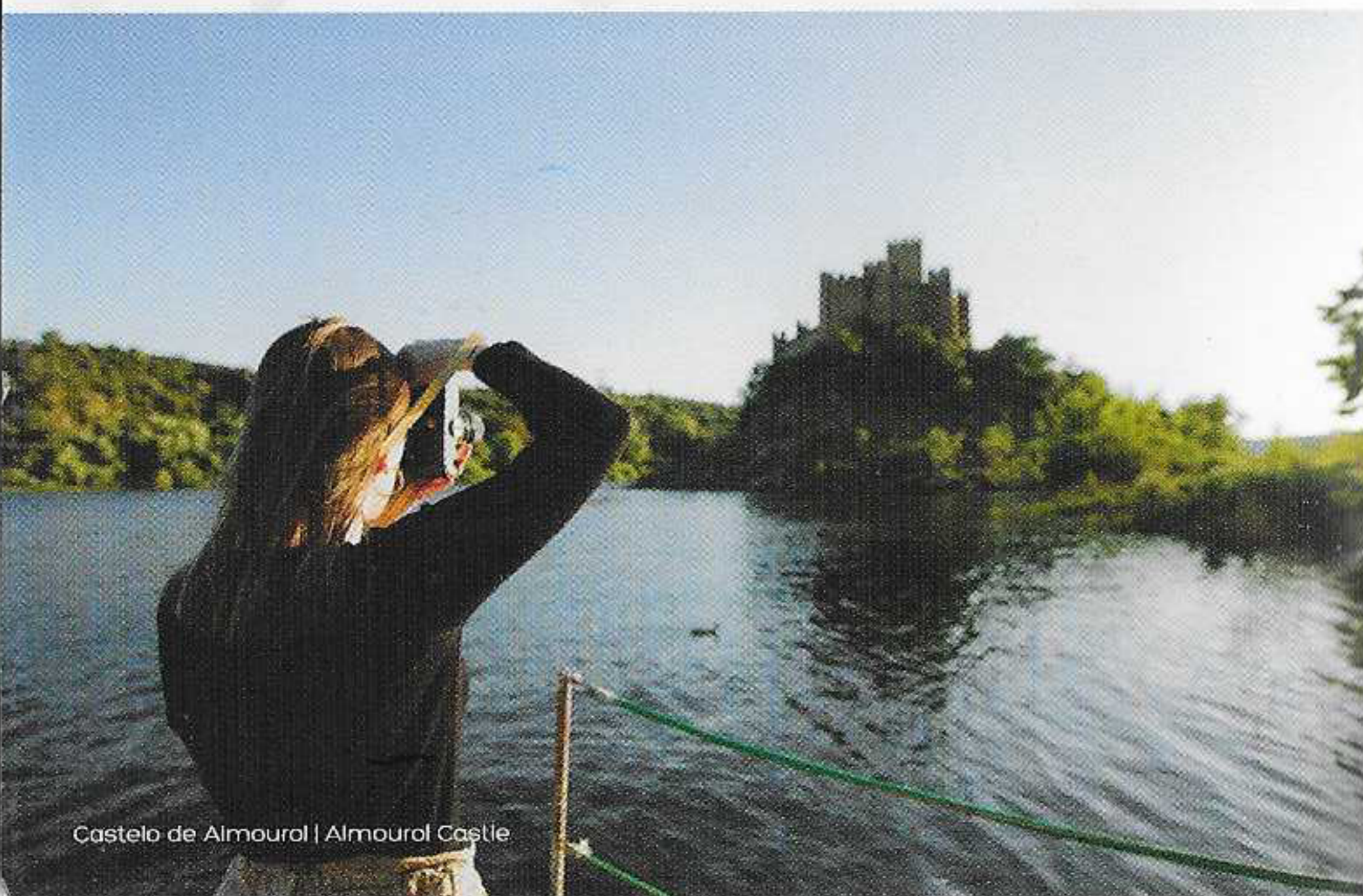
Castelo de Almourol | Almourol Castle